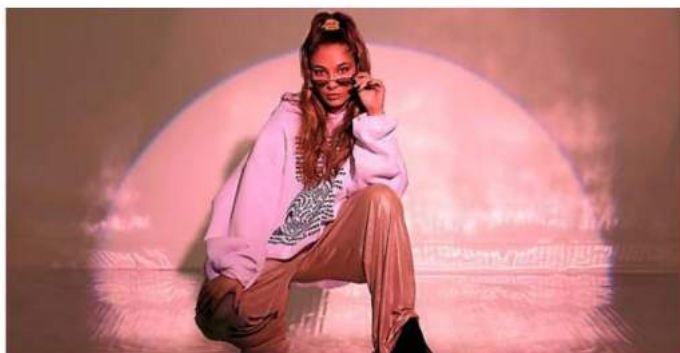
Chilla se démarque par des morceaux incisifs aux textes féministes.